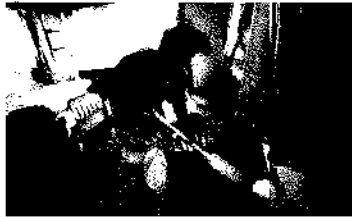
協力会員による家事援助サービス活動

⑩くじらほっとサービス 事業費合計 2,910,000円 高齢者の方、障害のある方、援助の必要な方など幅広い対象者の方に、家事援助サービスを提供します。